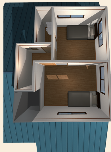
- 2階 -