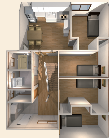
- 1階 -